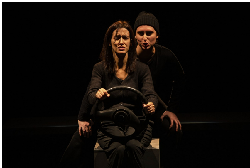
Pormenor de antigo espectáculo da companhia Marionet

Um colóquio internacional sobre a relação entre o teatro e a ciência vai decorrer em Coimbra, entre esta quinta-feira, 9, e sábado, 11, por iniciativa da universidade local, numa organização de várias estruturas desta instituição de ensino superior e da companhia de teatro Marionet . O encontro vai reunir profissionais das áreas da investigação e da arte para “debater os momentos e os motivos que potenciam o encontro entre as duas áreas, alargando o conhecimento sobre os diálogos entre teatro e ciência”, afirma a Universidade de Coimbra (UC), em nota de imprensa.