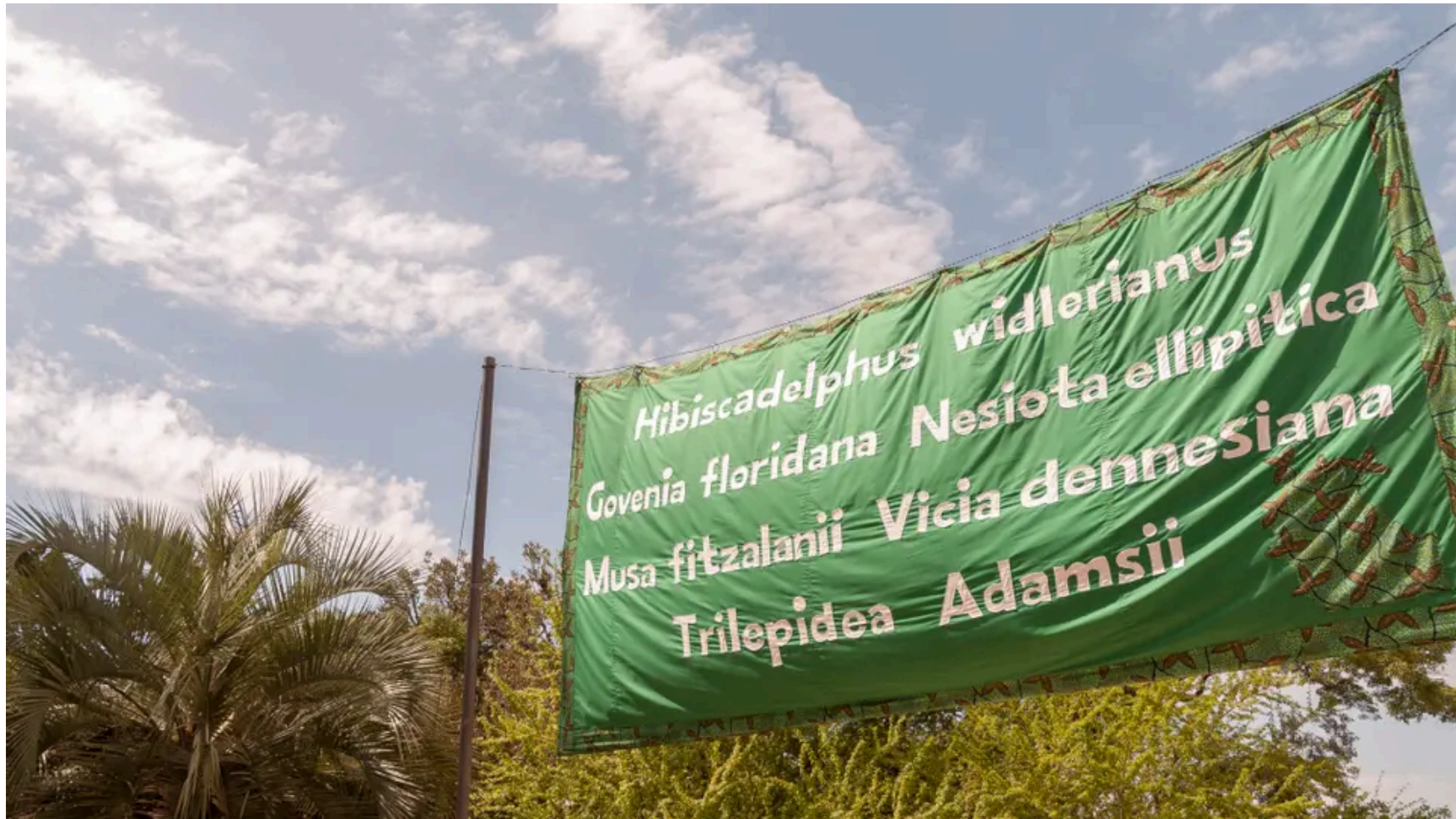
▲ A obra de Jeremy Deller, exposta na Anozero, está agora na Manifesta15, em Barcelona