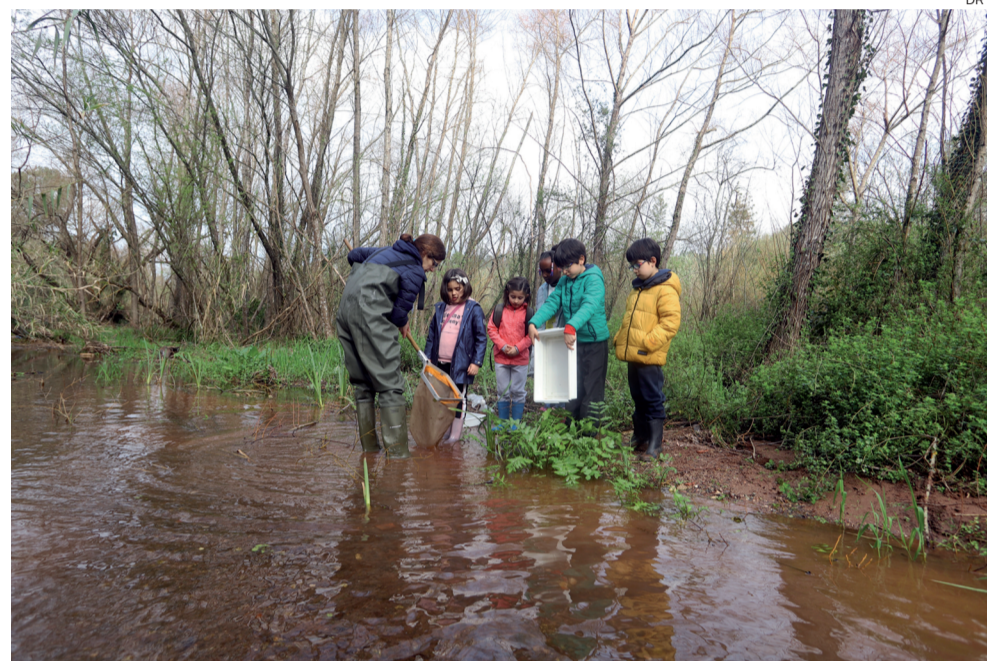
Na Ribeira de Coselhas um mundo ecológico para descobrir e aprender a preservar

Os alunos puderam observar que a Ribeira de Coselhas tem ainda troços de grande valor ecológico e elevada biodiversidade, onde a vegetação ribeirinha é densa e variada, com salgueiros e choupos e feto-real. Encontraram ainda espécies de anfíbios, como a salamandra de costelas-salientes, invertebrados aquáticos de elevada sensibilidade, como os plecópteros e diversas espécies de aves. No entanto, existem também troços bastante danificados que necessitam de ser recuperados, onde a vegetação