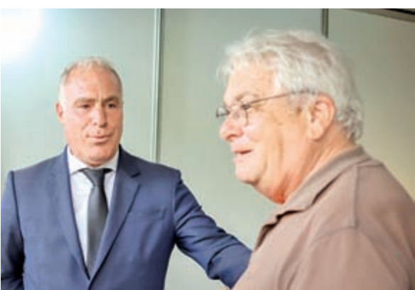
Presidente visitou expositores