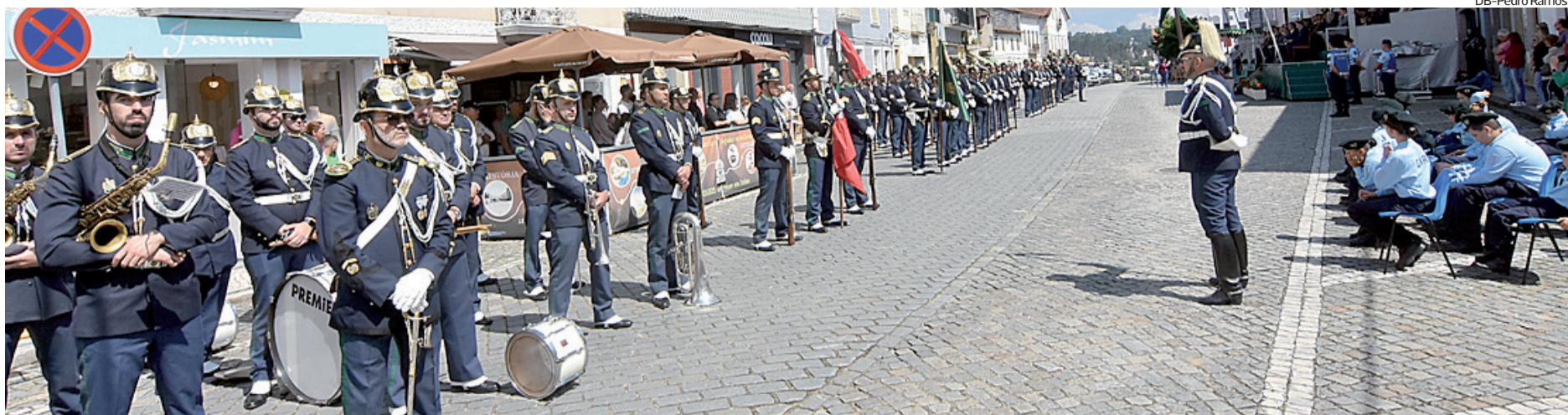
Comemorações decorreram no Largo Daniel de Matos, local do primeiro posto da GNR de Vila Nova de Poiares até 1989