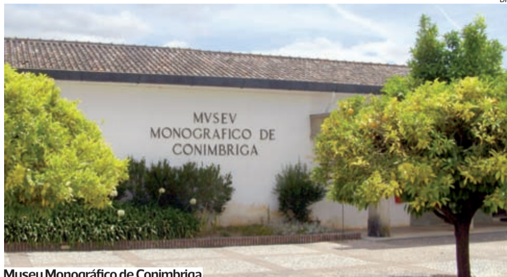
Museu Monográfico de Conimbriga

●●● A remodelação do Museu Monográfico de Conimbriga (MMC), em Condeixa-a-Nova, cujo projeto de arquitetura é apresentado hoje, pelas 15H00, vai facilitar no futuro a investigação do campo arqueológico, disse ontem o diretor.