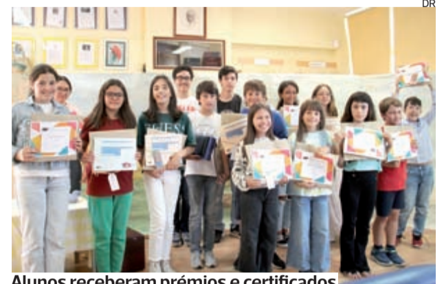
Alunos receberam prêmios e certificados