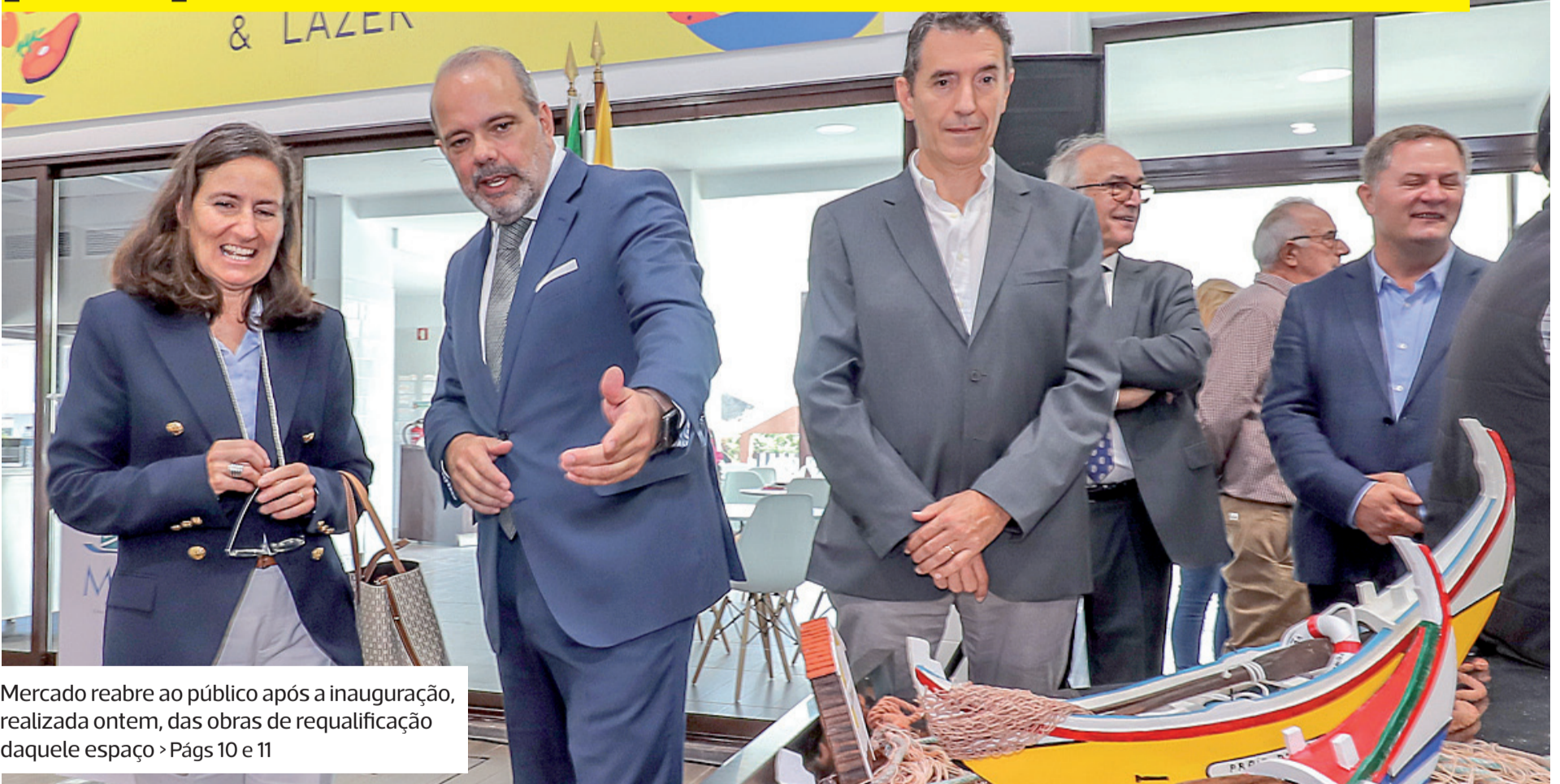
Mercado reabre ao público após a inauguração, realizada ontem, das obras de requalificação daquele espaço > Págs 10 e 11