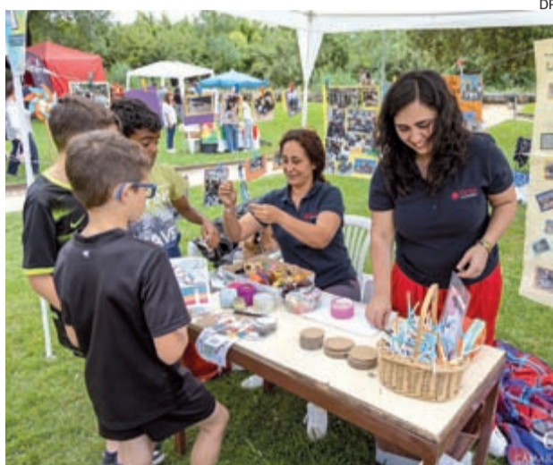
Mais de um milhar de pessoas participaram na festa