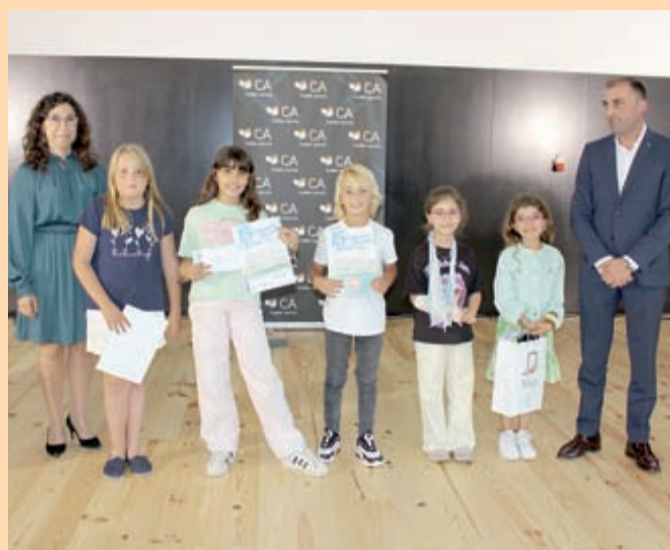
Concurso envolveu, e premiou, jovens alunos dos 1.º, 2.º e 3.º Ciclos do Ensino Básico e Secundário de Mira