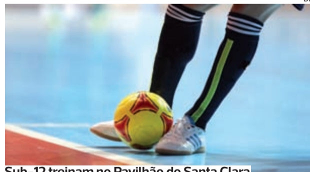
Sub-12 treinam no Pavilhão do Santa Clara

●●● A Associação de Futebol de Coimbra divulgou ontem a convocatória para o treino de observação da seleção distrital de futsal sub-12.