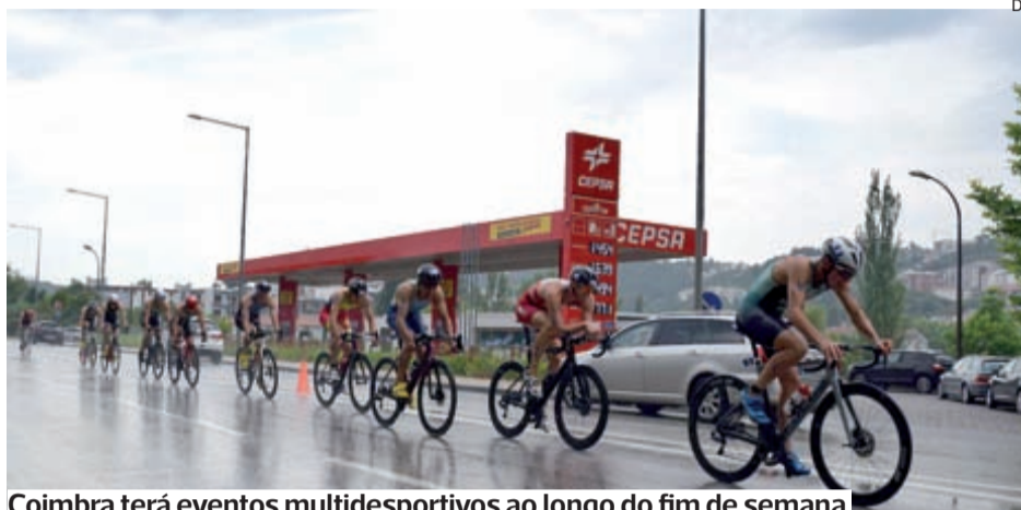
Coimbra terá eventos multidesportivos ao longo do fim de semana

Assim, durante o dia de hoje e as 24H00 de amanhã, é proibido estacionar em ambos os sentidos da avenida de Conimbriga (garantindo a entrada e saída dos SMTUC pela Luís Verney e do parque de estacionamento da Praça das Cortes pela Av. João das Regras), no parque de estacionamento do Choupal, no parque de estacionamento da Av. Marginal (junto à APA/Túnel da Casa do Sal) e no parque de estaciona-