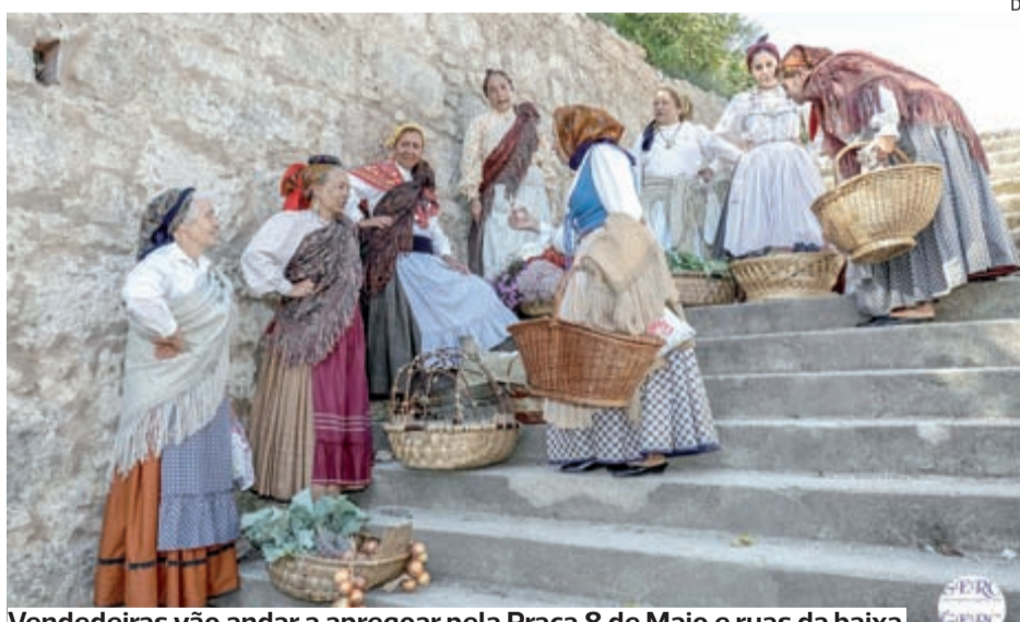
Vendedeiras vão andar a apregoar pela Praça 8 de Maio e ruas da baixa

A Mostra de Arte e Cultura Popular é um dos eventos que o GERC realiza com maior regularidade – esta será já a XXII edição na vida de uma associação que conta com 25 anos de história. O objetivo é levar à cidade, nas mesmas zonas onde se realizavam há dezenas, atividades tradicionais de artesanato e comércio.