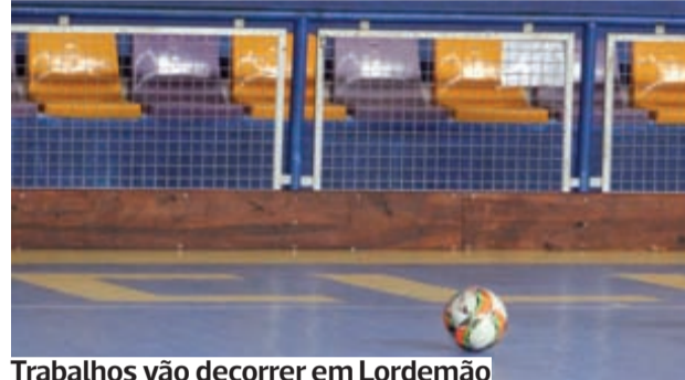
Trabalhos vão decorrer em Lordemão