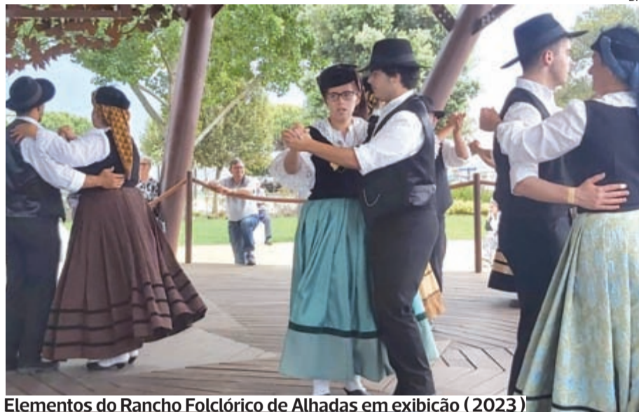
Elementos do Rancho Folclórico de Alhadense em exibição (2023)