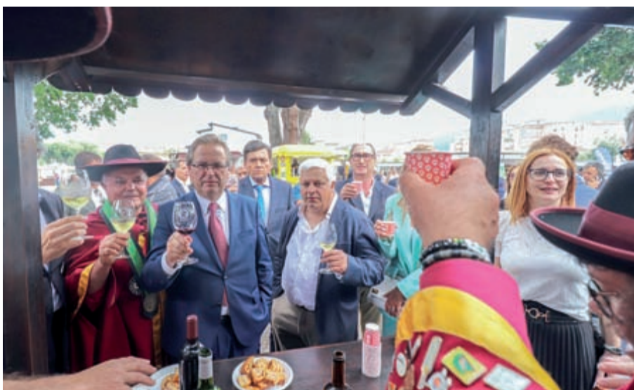
Entidades presentes visitaram os expositores presentes na Expo Miranda