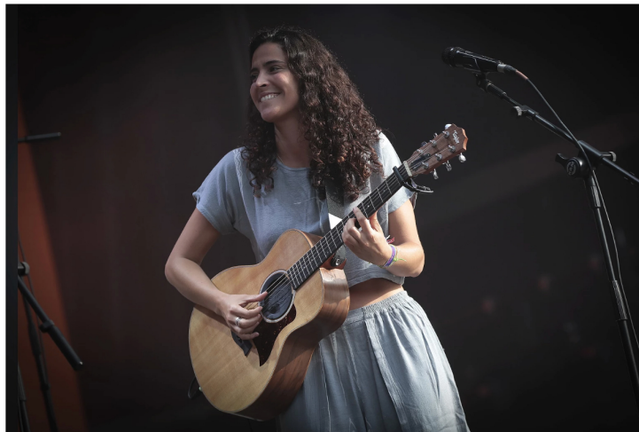
Maro - Lusa

A "Meia Temporada" da programação do Teatro Académico Gil Vicente (TAGV) de Coimbra, que comemora 63 anos de existência, vai promover mais de 80 eventos culturais até fevereiro de 2025.