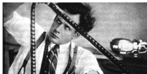
2 fev 2023 12:47 Ciclo dedicado a cinema de longa duração estreia-se no sábado em Coimbra

A "Meia Temporada" da programação do Teatro Académico Gil Vicente (TAGV) de Coimbra, que comemora 63 anos de existência, vai promover mais de 80 eventos culturais até fevereiro de 2025.