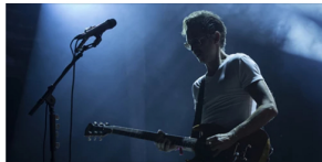
3 mar 2024 12:43 Teatro, dança e The Legendary Tigerman na programação do Teatro Académico de Gil Vicente