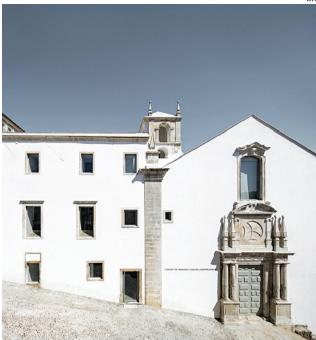
Projeto é amanhã apresentado no Colégio da Trindade

●●● A Universidade de Coimbra vai liderar um projeto de 9,5 milhões de euros, financiado pela Comissão Europeia, para combater a obesidade e promover estilos de vida saudáveis, que conta com a participação de 16 parceiros europeus.