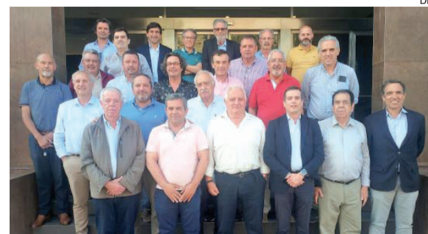
Presidente da AF Coimbra participou no encontro

●●● O Plenário das Associações Distritais e Regionais de Futebol, reunido na Guarda, reforçou entendimentos na atividade formativa e competitiva não profissional e enalteceu o crescimento do número de federados.