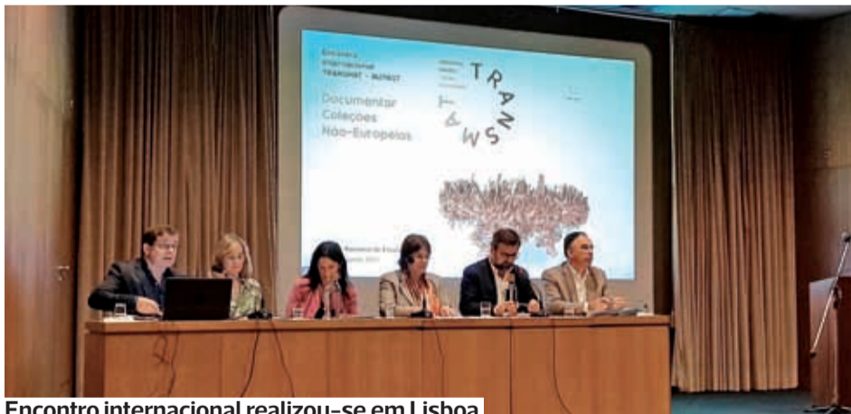
Encontro internacional realizou-se em Lisboa

●●● O Encontro Internacional TRANSMAT –IN2PAST realizou-se em Lisboa, no qual o Museu Municipal Santos Rocha participou com comunicações dos seus técnicos e de uma bolsreira.