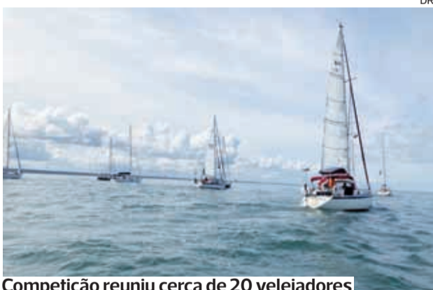
Competição reuniu cerca de 20 velejadores

●●● O Clube Náutico da Figueira da Foz (CNAFF) realizou, a 23 de junho a tradicional Regata de S. João. Na baía figueirense, estiveram presentes duas dezenas de velejadores distribuídos pelas classes de cruzeiro e ligeira.