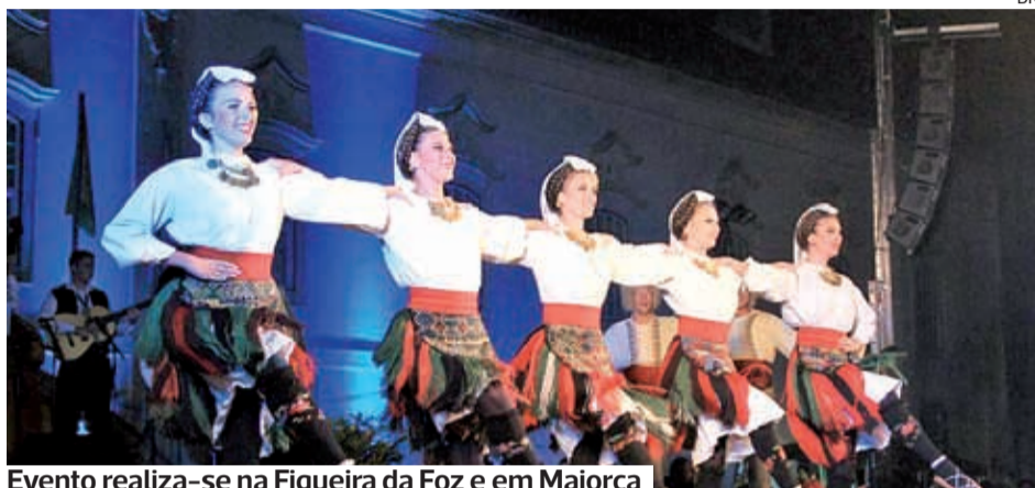
Evento realiza-se na Figueira da Foz e em Maiorca

O 47.º festival internacional de folclore FestiMaiorca, organizado pela Casa do Povo de Maiorca, com o apoio do Município da Figueira da Foz, realiza-se de 15 a 20 de julho. Os espetáculos principais decorrerão na cidade. Nesta edição, participam grupos de Espanha, Colômbia, México, Sérvia, Venezuela, Taiwan e Portugal.