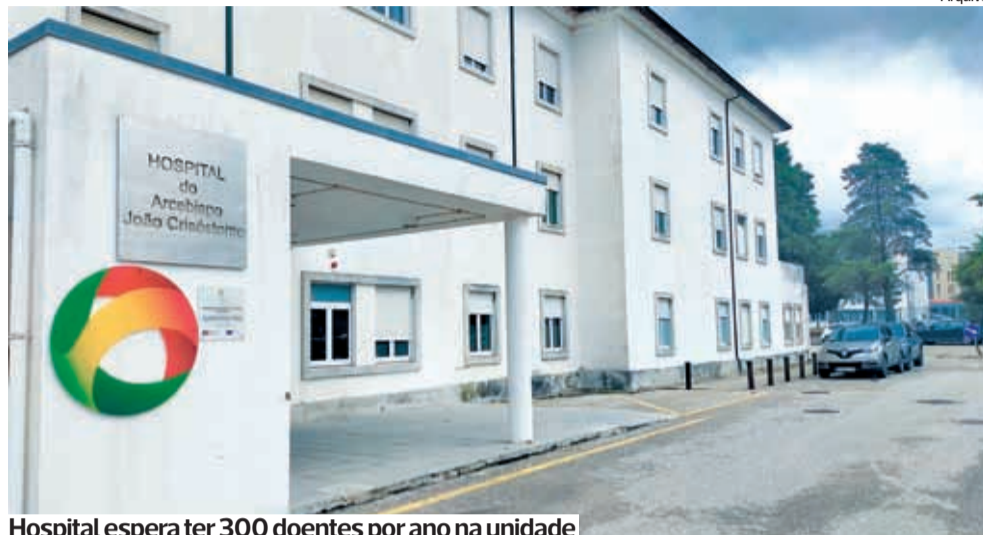
Hospital espera ter 300 doentes por ano na unidade

●●● O Hospital Arcebispo João Crisóstomo (HAJC), em Cantanhede, pretende ter sete camas destinadas ao internamento de doentes agudos no hospital.