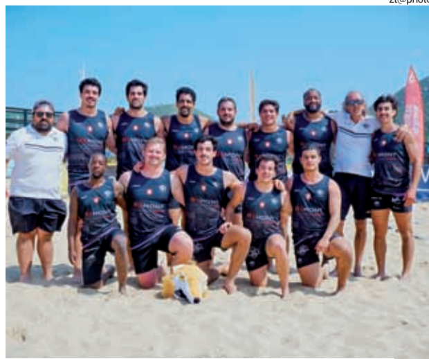
AAC Sand Foxes foram a melhor equipa nacional