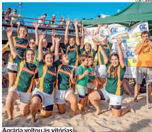
Agrária voltou às vitórias