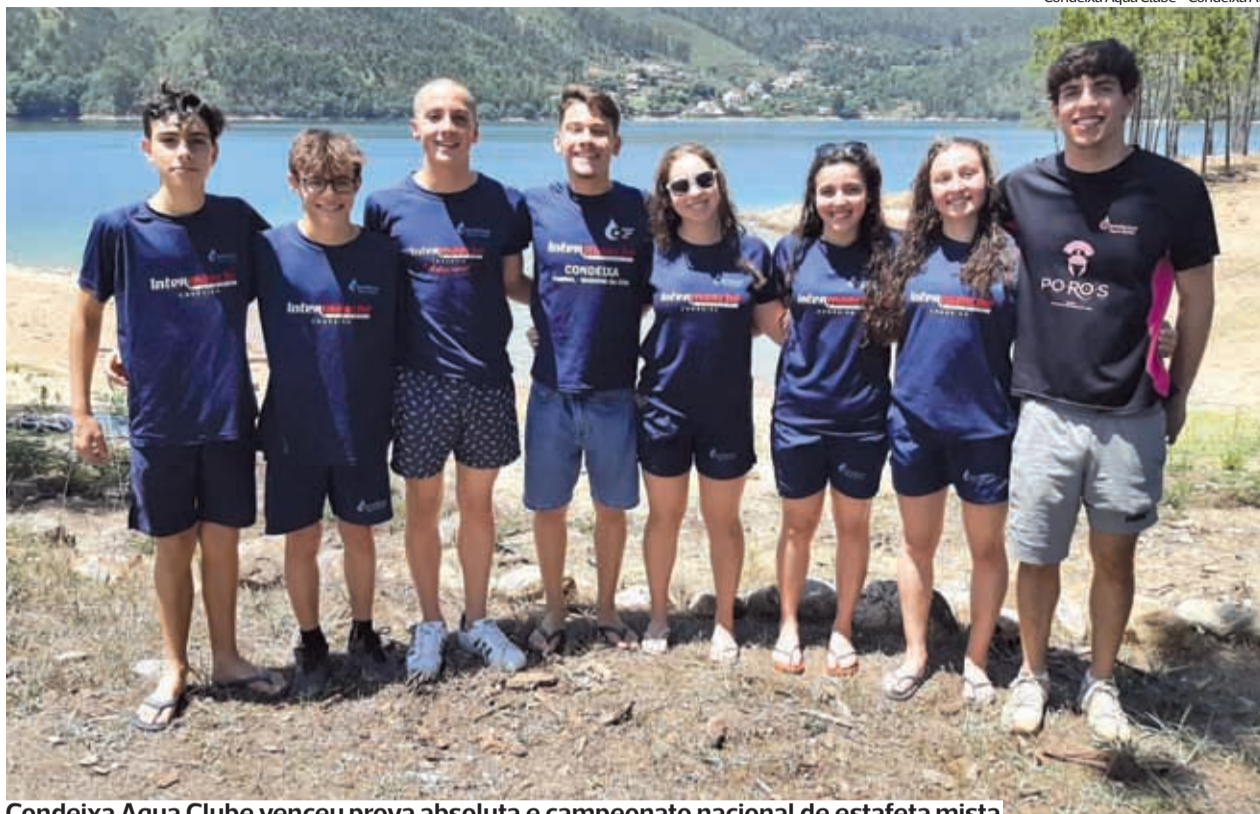
Condeixa Aqua Clube venceu prova absoluta e campeonato nacional de estafeta mista

No final do dia, após as três mangas, ainda houve tempo para a frota se juntar à já habitual procissão e bênção do mar.