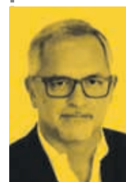
Manuel Rascão Marques deputado municipal /PSD