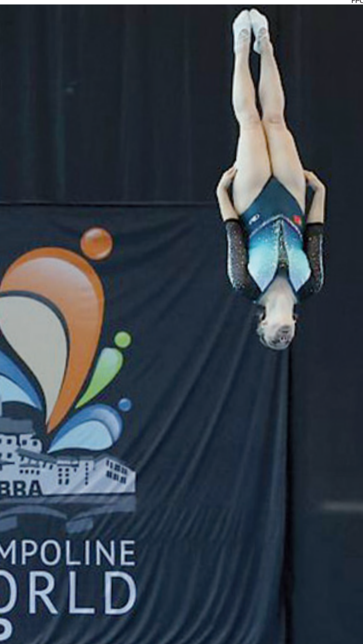
competição (qualificações e finais) a estar marcada para os dias 7 e 8 de julho