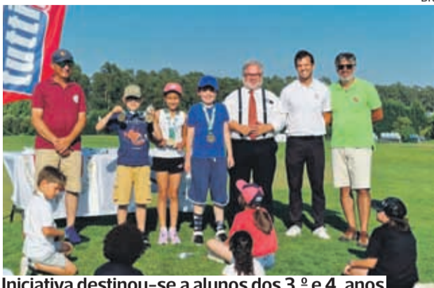
Iniciativa destinou-se a alunos dos 3.º e 4.º anos

●●● A fase final do Drive School, para alunos dos 3.º e 4.º anos das escolas do 1.º ciclo do concelho de Cantanhede, realizou-se no passado fim de semana.