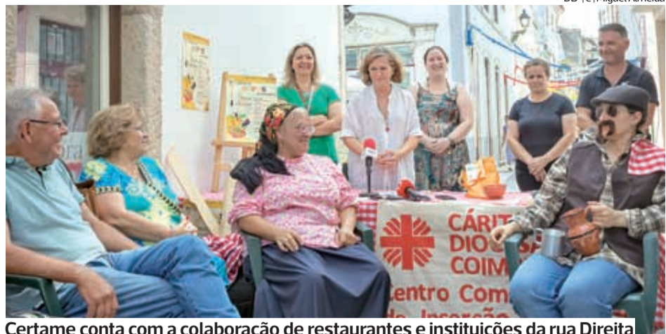
Certame conta com a colaboração de restaurantes e instituições da rua Direita

A conferência acolhe mais de 100 comunicações e reúne cerca de 150 participantes, académicos e especialistas oriundos de 19 países.