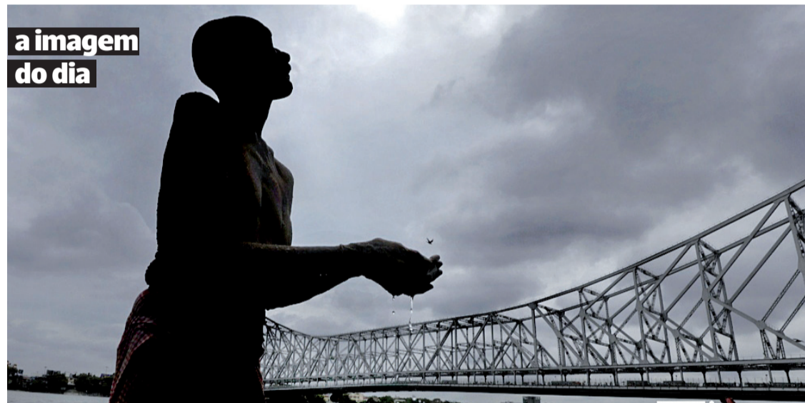
Homem reza, depois de um mergulho no rio Ganges, perto da ponte de Haora, enquanto nuvens cobrem o céu antes que uma chuva de monções atinja Calcutá (Índia).