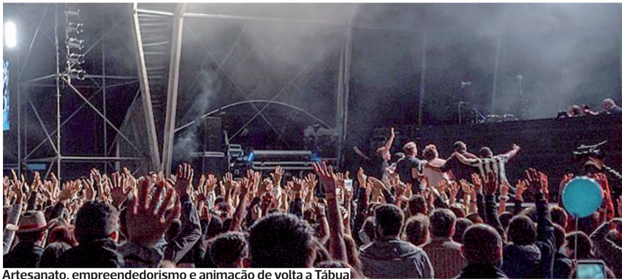
Artesanato, empreendedorismo e animação de volta a Tábua

●●● Começa hoje a XXII edição da Feira Agrícola, Comercial e Industrial de Tábua (FACIT). O certame vai ter lugar no Pavilhão Multiusos e, até ao dia 2 de julho, vai ser possível aceder a zonas de artesanato, doçaria, produtos endógenos, motorizados, automóveis, agrícolas e muito mais.