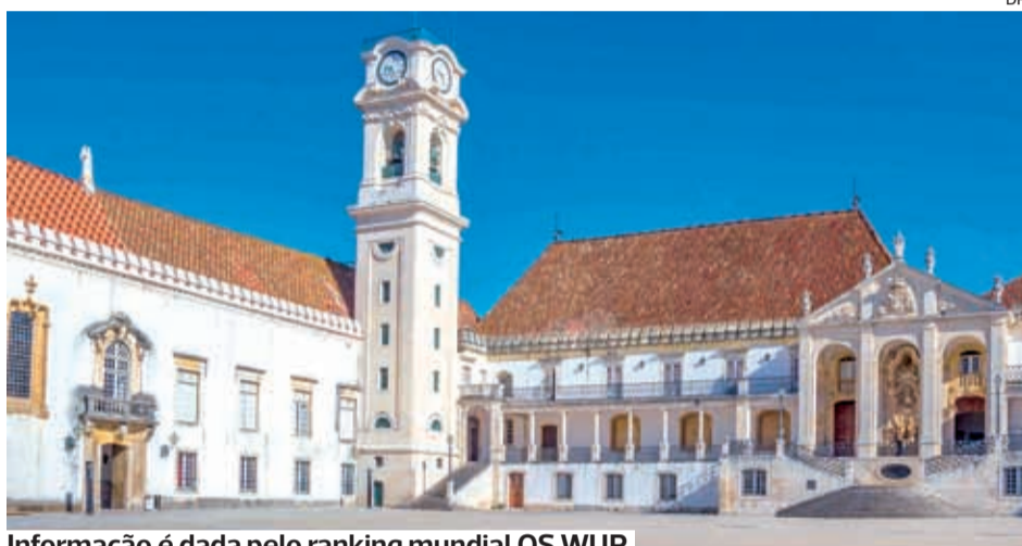
Informação é dada pelo ranking mundial QS WUR

“É com enorme satisfação que vemos também este prestigiado ranking a atestar os nossos esforços perante os desafios da sustentabilidade, depois de no início do mês termos sido reconhecidos pelo quarto ano consecutivo pelo Times