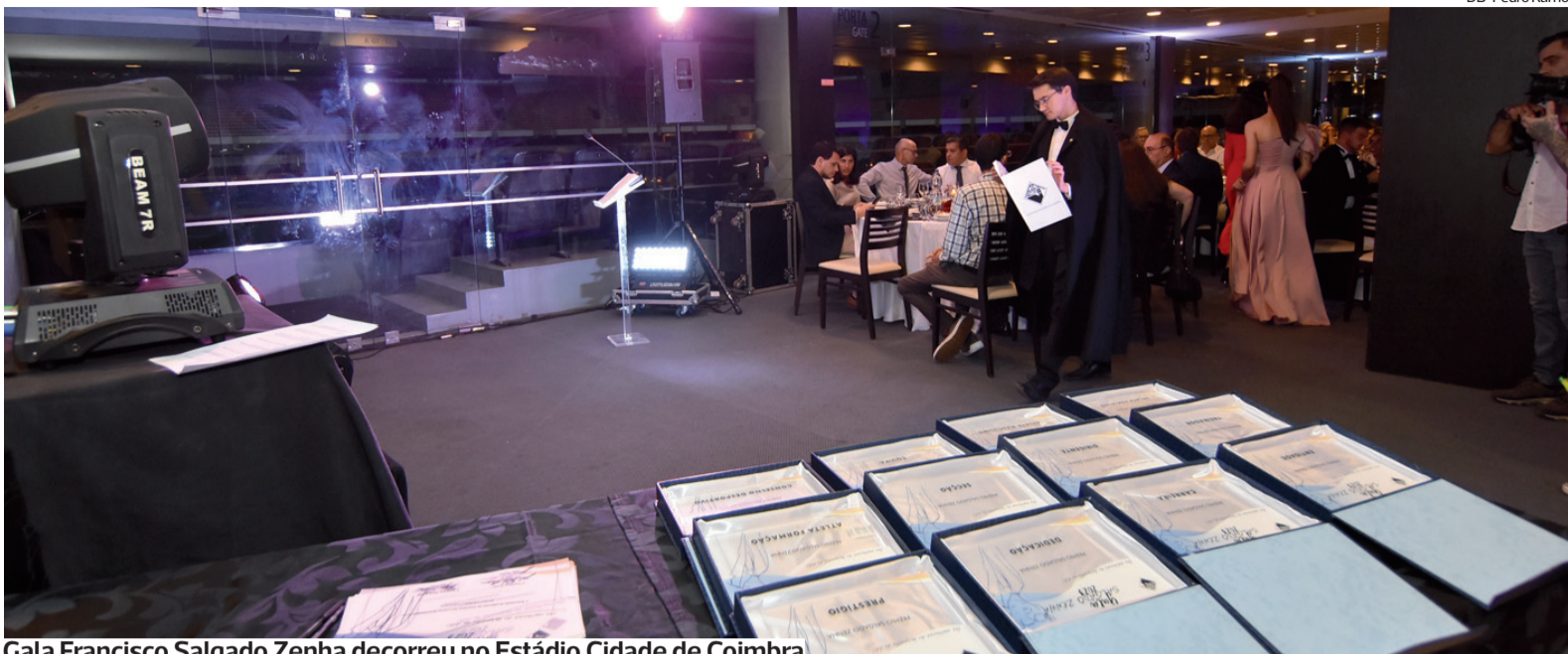
Gala Francisco Salgado Zenha decorreu no Estádio Cidade de Coimbra