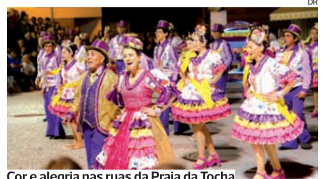
Cor e alegria nas ruas da Praia da Tocha

●●● As ruas da Praia da Tocha encheram-se, no passado sábado, de cor, música e animação, no âmbito dos festejos em honra do São João.