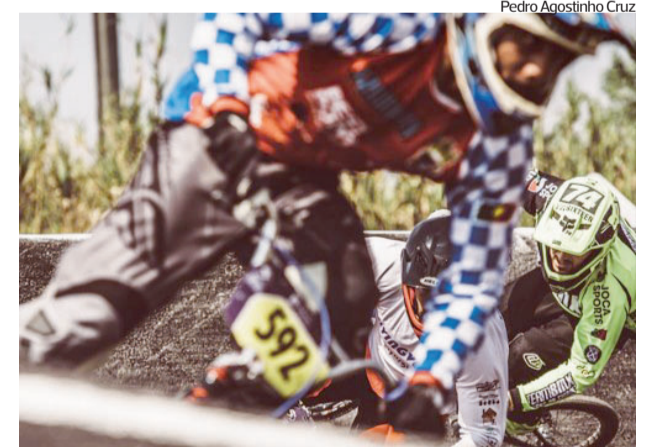
Campeonato disputa-se domingo na pista figueirense

●●● O título nacional de BMX Race 2023 decide-se no domingo, na Figueira da Foz. As decisões estão marcadas para a Pista Municipal de Vila Verde. A competição decorre apenas no domingo, mas a animação