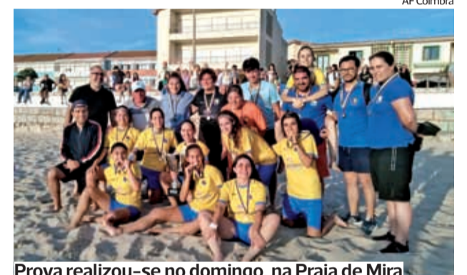
Prova realizou-se no domingo, na Praia de Mira

●●● A equipa do UR Cadima venceu, no passado domingo, o Troféu Distrital de Seniores Femininos de futebol de praia, na Praia de Mira, onde o muro feito bancada se encheu de fans da... elegância!