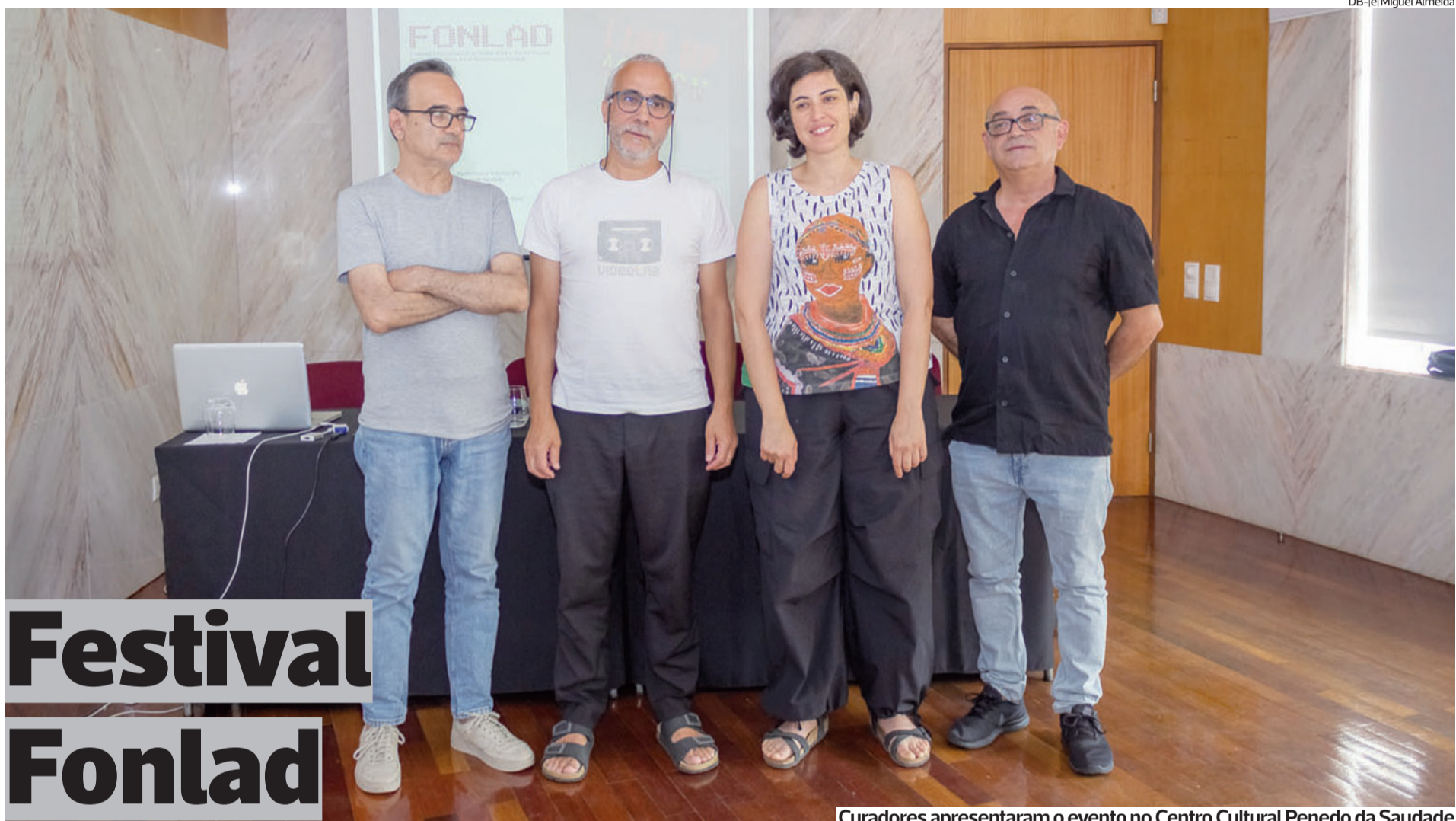
Curadores apresentaram o evento no Centro Cultural Penedo da Saudade