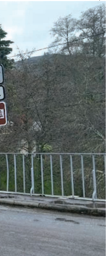
das Três Entradas liga três freguesias