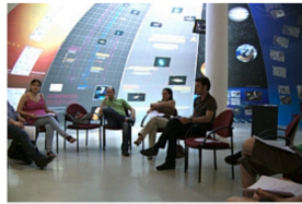
Ensaios para a «Noite dos investigadores»

Adicionar aos favoritos / Compartilhar X