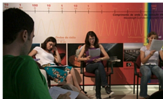
O quotidiano dos investigadores com «Cientistas no palco»

Decorre pela segunda vez em Coimbra e convida cientistas a subir ao palco para interpretar peças produzidas para o evento.