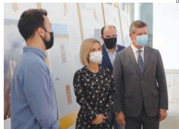
Direção Regional da Cultura e CIM-RC presentes na inauguração

●●● Imagens de alta definição captadas ao longo de um périplo pelos 19 concelhos da Comunidade Intermunicipal da Região de Coimbra (CIM-RC) estão em exposição, desde sábado passado, na Pampilhosa da Serra.