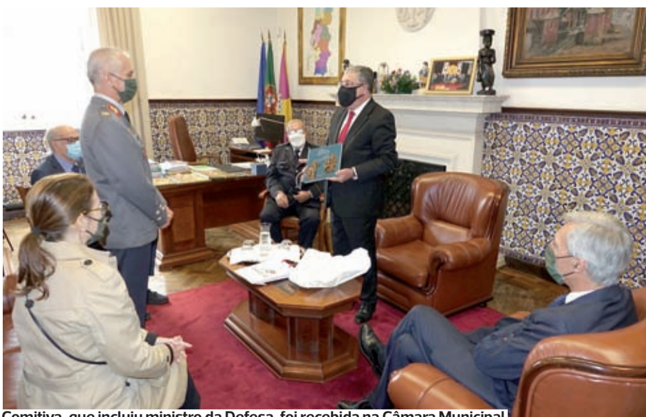
Comitiva, que incluiu ministro da Defesa, foi recebida na Câmara Municipal