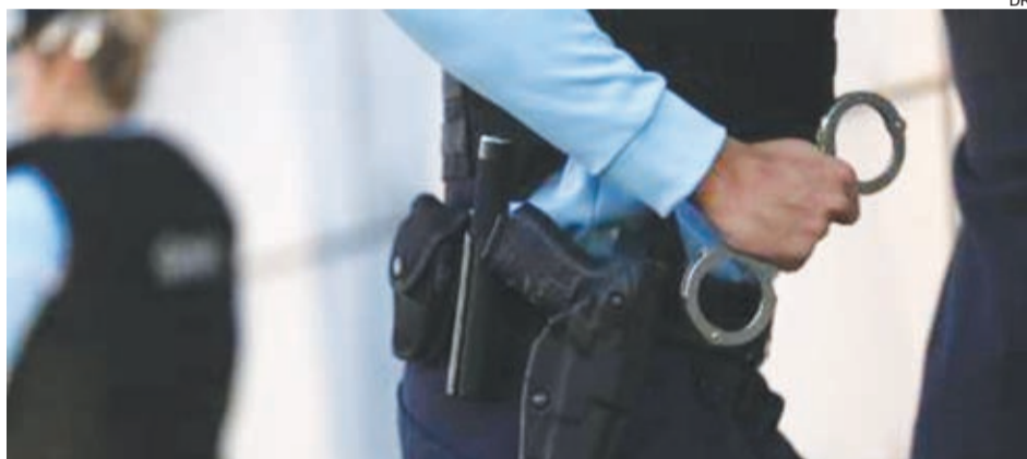
Militares apuraram que suspeito infligiu "maus-tratos físicos e verbais" sobre a mulher, de 45

De 1 de janeiro a 30 de setembro deste ano, a PSP registou uma média de 40,5 casos por dia, totalizando 11.100 crimes de violência doméstica