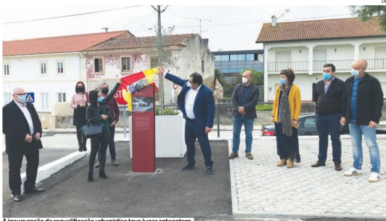
A inauguração da requalificação urbanística teve lugar anteontem