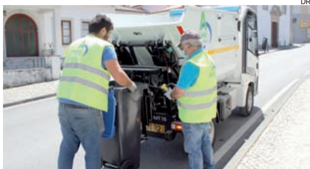
Sistema de valorização e seleção de resíduos porta a porta