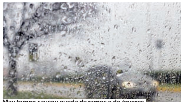
Mau tempo causou queda de ramos e de árvores

Foram ainda realizadas 10.549 propostas de aplicação de medida de coação ao/à ofensor/a (38,5 por dia) e 8.219 propostas de sinalização de menores à Comissão de Proteção de Crianças e Jovens em Risco (média de 30/dia).