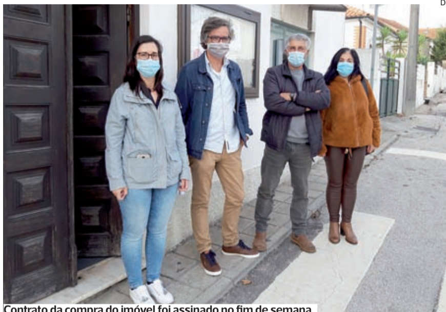
Contrato da compra do imóvel foi assinado no fim de semana

●●● A Junta de Vila Verde vai mudar-se para o rés-do-chão de um prédio próximo da atual sede. O contrato para a aquisição do espaço, por 130 mil euros, foi assinado no sábado e a escritura está agendada para o fim de fevereiro. A Câmara da Figueira da Foz assume a compra do imóvel, cabendo à autarquia vilaverdense suportar os custos da adaptação das novas instalações.