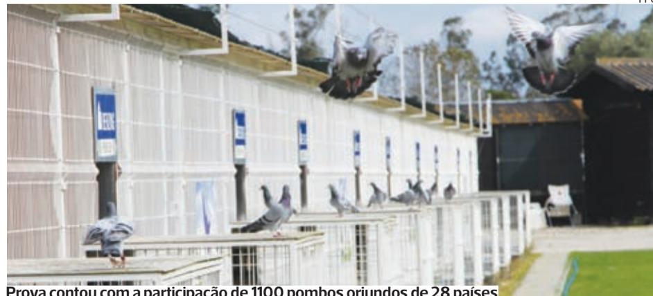
Prova contou com a participação de 1100 pombos oriundos de 28 países

A 23.ª edição dos Campeonatos Internacionais de Columbofilia-Mira 2020 decorreu no Columbódromo