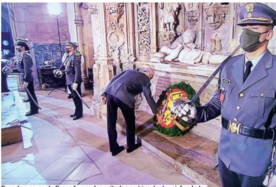
Espada e coroa de flores foram depositadas no túmulo do rei-fundador