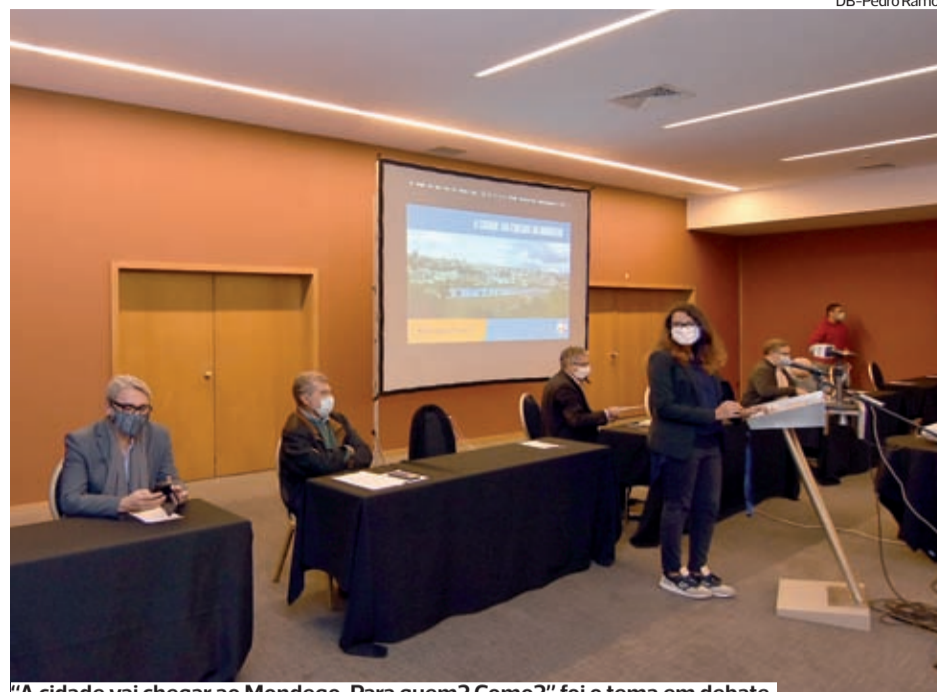
"A cidade vai chegar ao Mondego. Para quem? Como?" foi o tema em debate