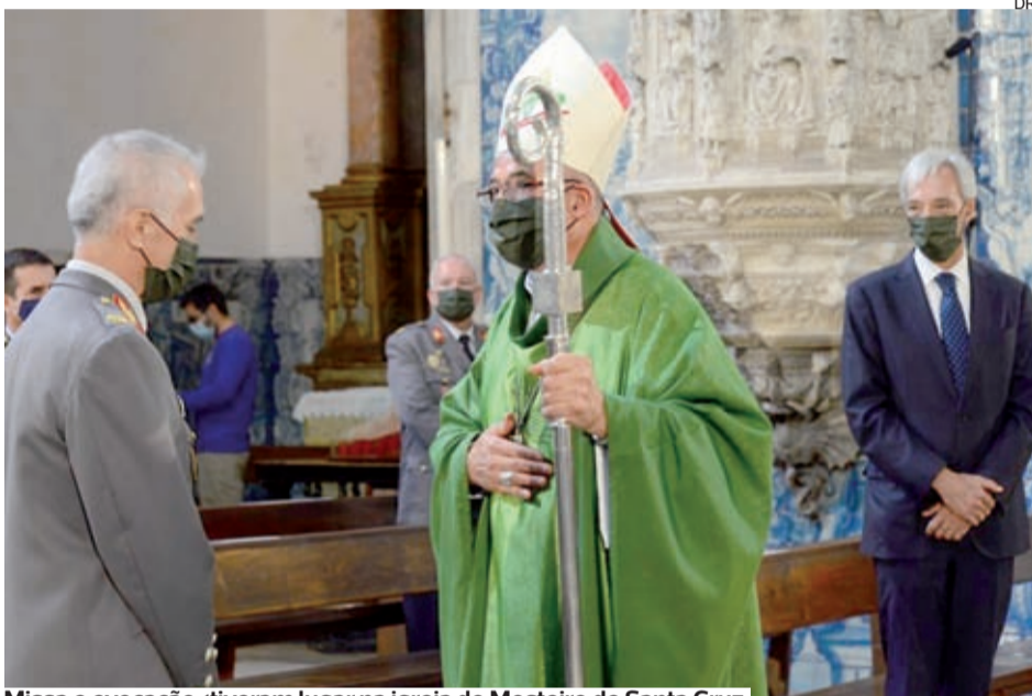
Missa e evocação tiveram lugar na igreja do Mosteiro de Santa Cruz