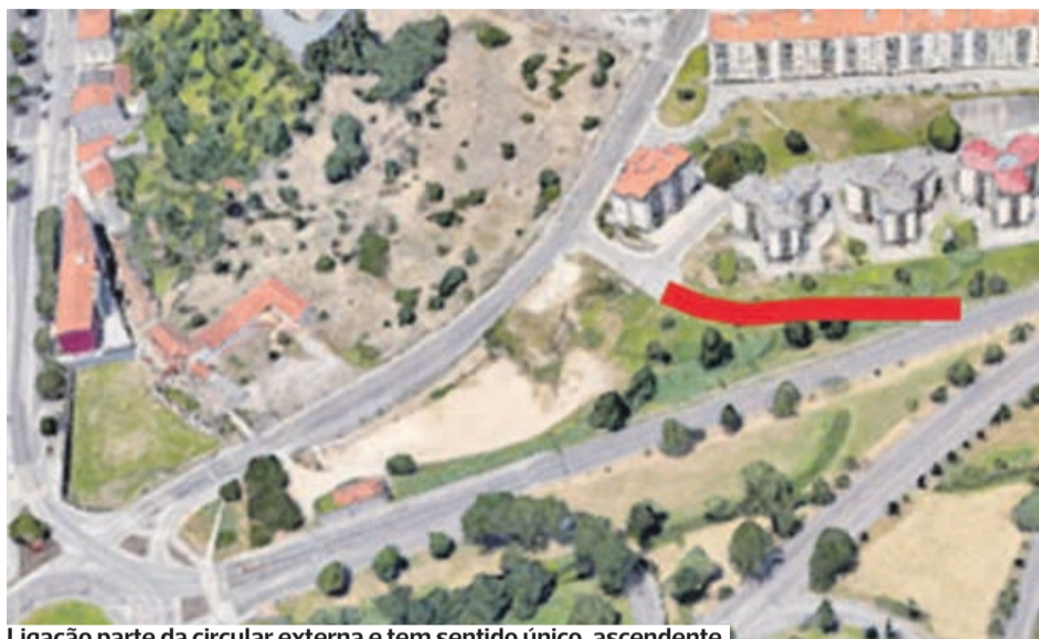
Ligação parte da circular externa e tem sentido único, ascendente

●●● O acesso ao bairro Monte Formoso, a partir da Circular Externa, vai passar a ser feito por uma nova via, evitando, assim, a passagem pela Casa do Sal.