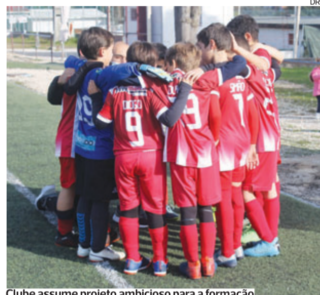
Clube assume projeto ambicioso para a formação