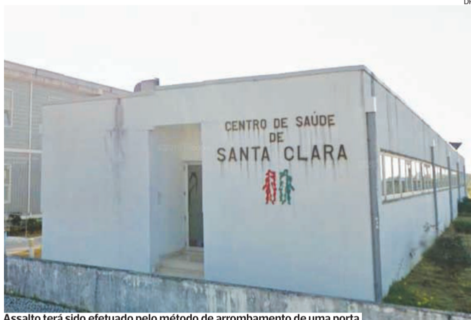
Assalto terá sido efetuado pelo método de arrombamento de uma porta

Segundo fonte da unidade de saúde, a situação não é inédita. PSP de Coimbra esteve no local e está a investigar