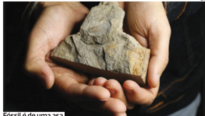
Fóssil é de uma asa