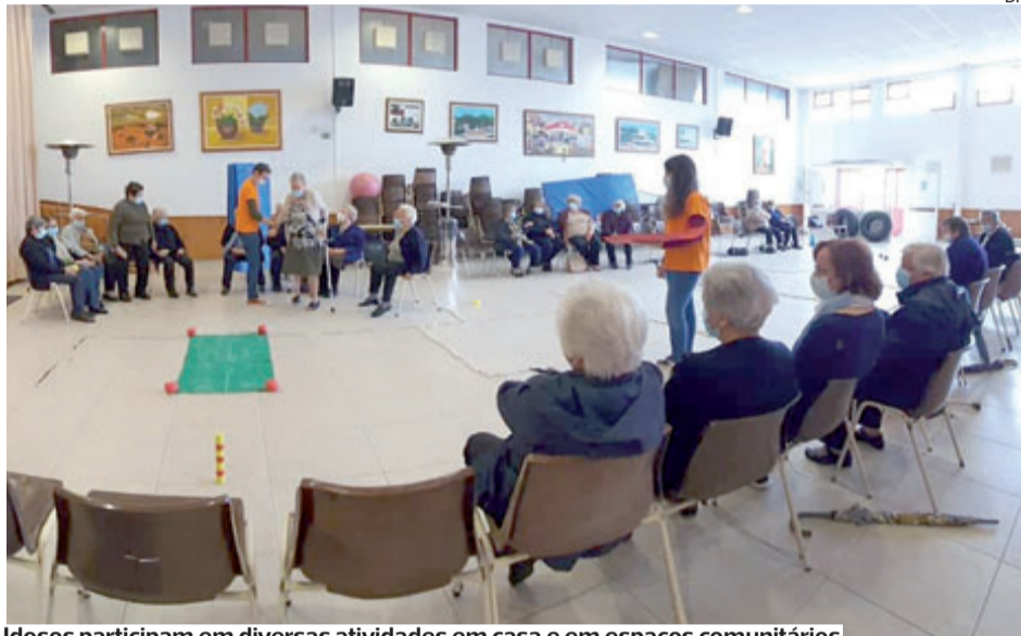
Idosos participam em diversas atividades em casa e em espaços comunitários

No total, o eixo de intervenção “promoção do envelhecimento ativo e apoio à população idosa” chega a cerca de 20 localidades: Casais de São Clemente, Lamas, Chão de Lamas, Cara-