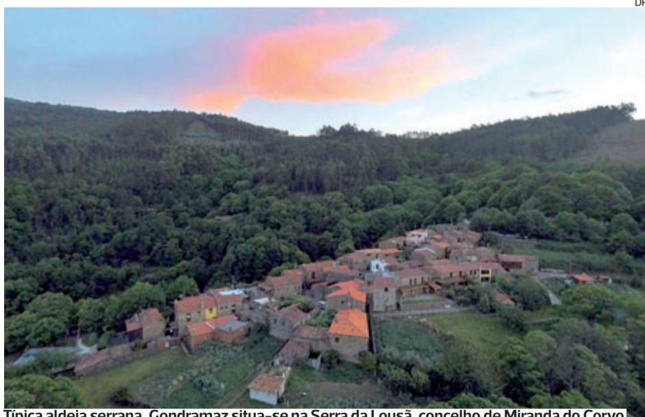
Típica aldeia serrana, Gondramaz situa-se na Serra da Lousã, concelho de Miranda do Corvo

Trata-se do projeto F4F - Forest For Future, liderado pelo SerQx - Centro de Inovação e Competências