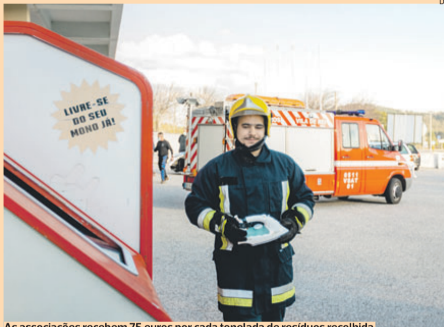
As associações recebem 75 euros por cada tonelada de resíduos recolhida

O Prémio Regional Centro (Aveiro, Coimbra e Viseu) foi atribuído à Associação Humanitária dos Bombeiros Voluntários da Figueira da Foz, que reuniu mais de 91 toneladas. Pelo esforço, cada uma destas duas associações recebeu 750 euros em cartões pré-pagos de combustível.