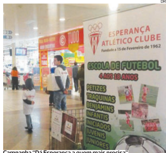
Campanha “Dá Esperança a quem mais precisa”

“Isto traz muita chatice e ausência de casa, mas custa muito não contribuir para a alegria das crianças. Por isso, tal como vim para aqui porque não havia ninguém, não quero deixar fechar a porta se não aparecer outra lista”, explica o dirigente.