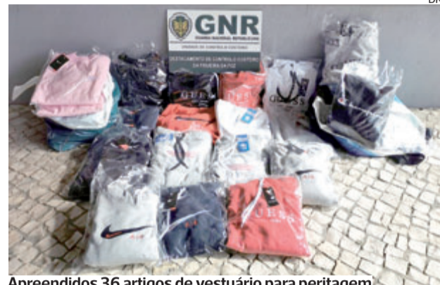
Apreendidos 36 artigos de vestuário para peritagem

●●● A Unidade de Controlo Costeiro da GNR, através do Subdestacamento de Controlo Costeiro de Aveiro, identificou, na sexta-feira, “um homem de 66 anos por contrafação, no concelho de Aveiro”, foi ontem anunciado.