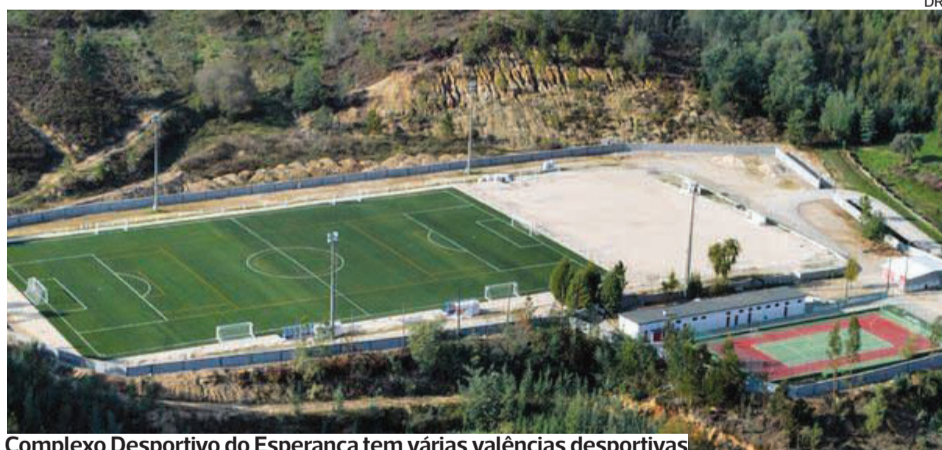
Complexo Desportivo do Esperança tem várias valências desportivas

Quase a fazer 30 anos nas atuais instalações, o clube