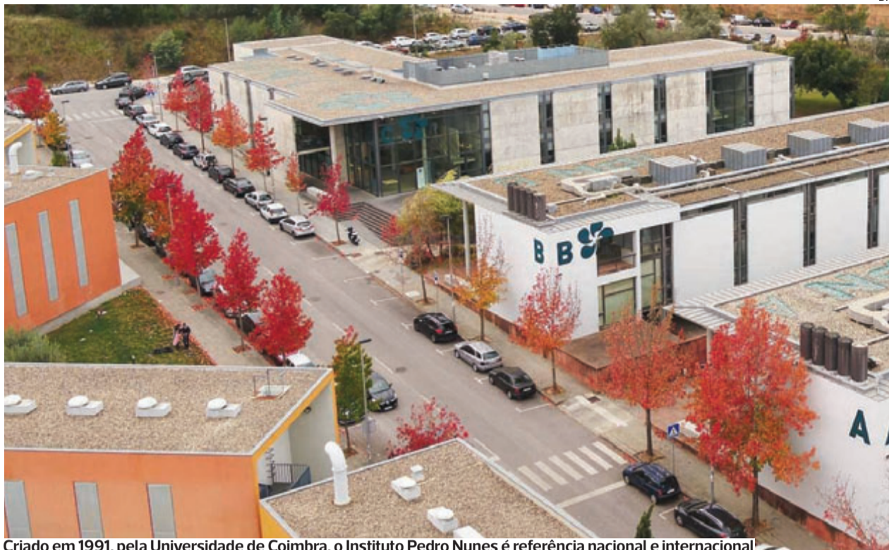
Criado em 1991, pela Universidade de Coimbra, o Instituto Pedro Nunes é referência nacional e internacional