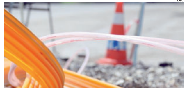
Município estabeleceu contrato com empresa especializada