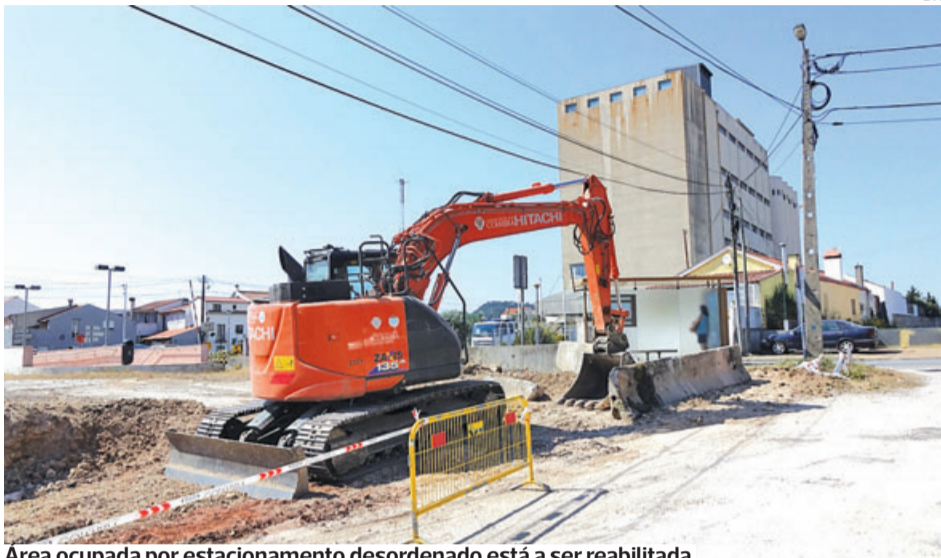
Area ocupada por estacionamento desordenado está a ser reabilitada

●●● A Câmara de Coimbra está a reabilitar um espaço público no Beco do Olheiro, na Adémia, atualmente utilizado para estacionamento desordenado. Objetivo é eliminar as vedações e construções precárias existentes, reorganizar o estacionamento e criar uma zona de lazer e a plantação de árvores.