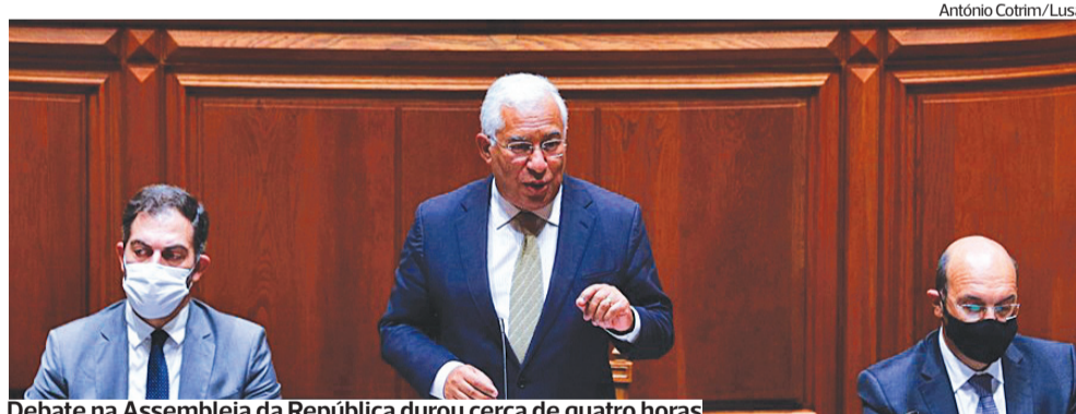
Debate na Assembleia da República durou cerca de quatro horas

António Costa apontou que, de forma global, em