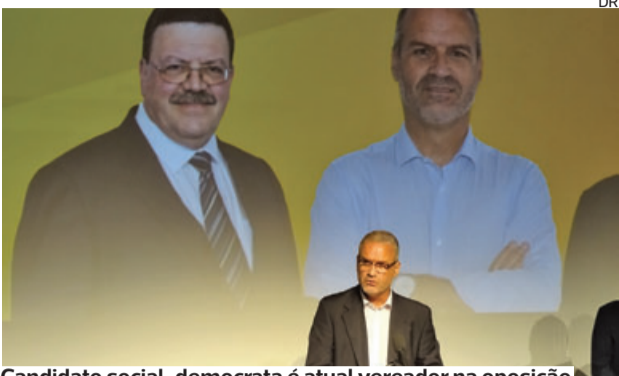
Candidato social-democrata é atual vereador na oposição