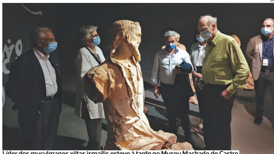
Líder dos muçulmanos xiitas ismailis esteve à tarde no Museu Machado de Castro

O evento ficou adiado, sem data oficial. No entanto, os bilhetes já adquiridos mantêm-se.