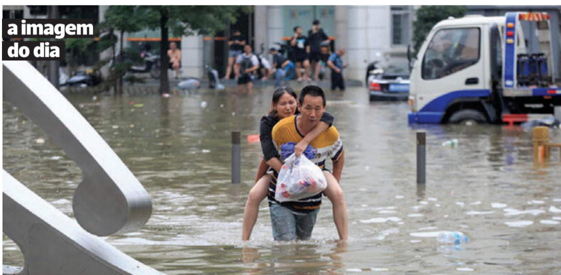
a imagem do dia

Pelo menos 25 pessoas morreram na China na província central de Henan que foi fortemente atingida pelas inundações. Os funcionários meteorológicos chineses consideraram as chuvas como as mais fortes dos últimos 1000 anos. China Daily