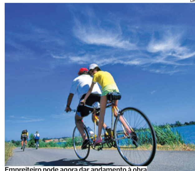
Empreiteiro pode agora dar andamento à obra

●●● O Tribunal de Contas acaba de conceder o necessário visto para o início da construção do trajeto da Rota Eurovelo (ciclovía) na Figueira da Foz, Cantanhede (Tocha) e Mira.