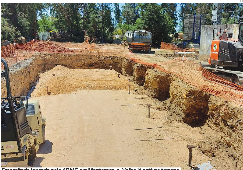
Empreitada lançada pela ABMG em Montemor-o-Velho já está no terreno

De acordo com a PJ, o suspeito de abusos sexuais de crianças, que é pintor de construção civil de profissão, vai ser presente às autoridades judiciais para aplicação das medidas de coação.