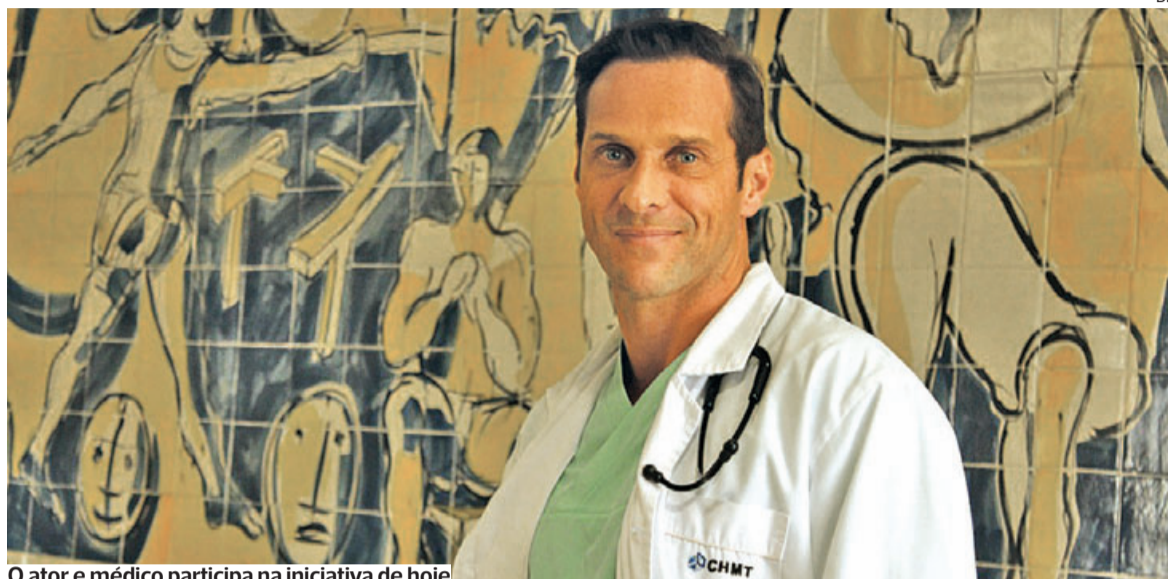
O ator e médico participa na iniciativa de hoje

Em caso de dúvidas, não hesite e procure um Solicitador.