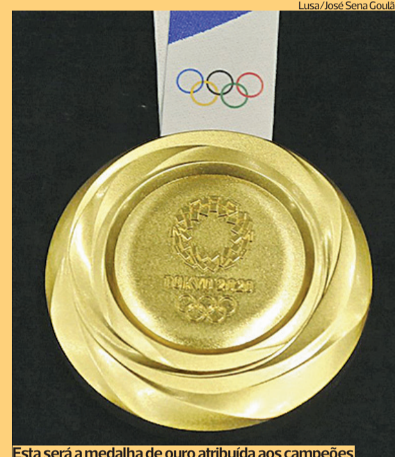
Esta será a medalha de ouro atribuída aos campeões

●●● Tóquio2020 vai ter 339 medalhas de ouro em disputa nas 33 modalidades do programa, sendo que mais de um quarto (28,6%) serão distribuídas por natação e atletismo e quase metade (45,7%) por outros maiores desportos.