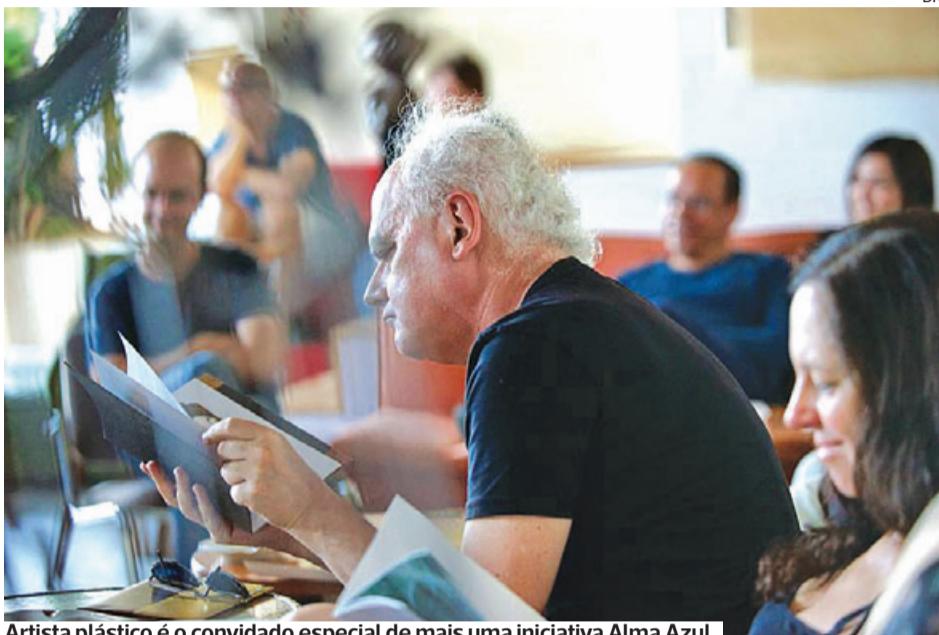
Artista plástico é o convidado especial de mais uma iniciativa Alma Azul

●●● A Alma Azul promove a segunda iniciativa do programa Coimbra Literária = 1991-2021, no Museu da Água, no próximo domingo, dia 25, entre as 10H00 e as 12H00.