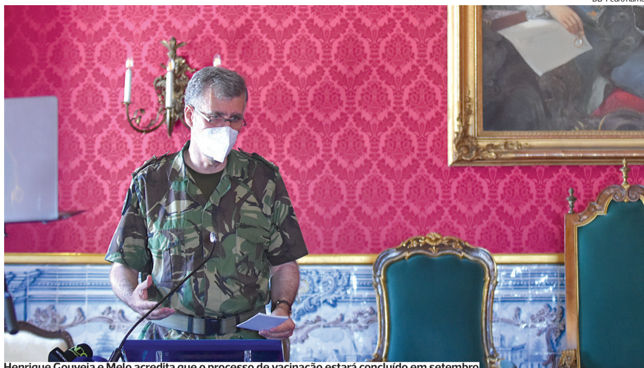
Henrique Gouveia e Melo acredita que o processo de vacinação estará concluído em setembro

“Aguardamos uma decisão final da Direção Geral de Saúde sobre a vacinação desta população. Mas tudo está preparado para nos fins de semana entre 14 de agosto e 19 de setembro serem administradas as duas doses de vacina às cerca de 570 mil crianças e jovens entre os 12 e os 17 anos”, declarou o primeiro-ministro.