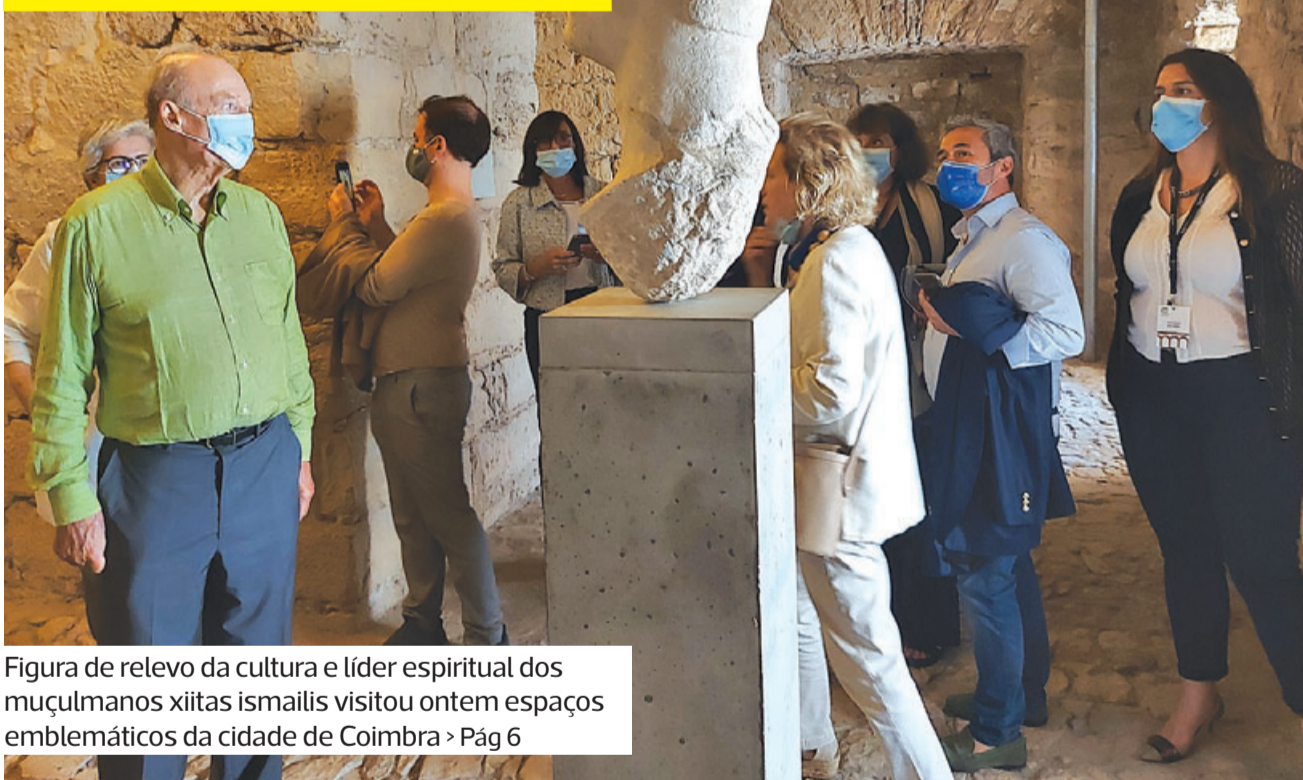
Figura de relevo da cultura e líder espiritual dos muçulmanos xiitas ismailis visitou ontem espaços emblemáticos da cidade de Coimbra > Pág 6