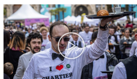
EMPREGADOS DE MESA FIZERAM 2KM DE TABULEIRO NA MÃO. É (...)