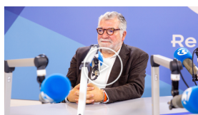
NOVO GOVERNO "TEM QUE DAR PRIORIDADE À REDUÇÃO DO IRC (...)