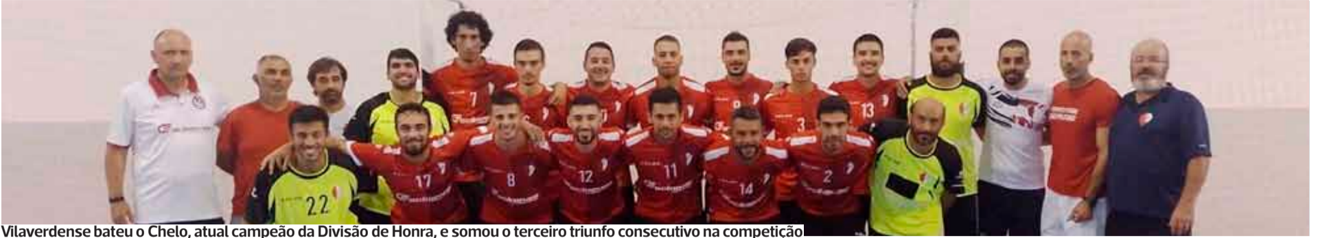
Vilaverdense bateu o Chelo, atual campeão da Divisão de Honra, e somou o terceiro triunfo consecutivo na competição