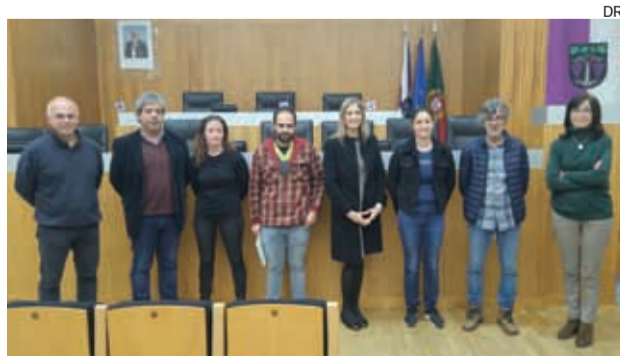
Protocolo foi assinado com as clínicas veterinárias

zação e de identificação de animais de companhia é dirigida aos titulares de animais de companhia, cães e gatos, que residam no concelho de Anadia. A participação municipal aplica-se a atos cirúrgicos até três canídeos e três gatídeos felídeos, não podendo no total ser excedido o número de seis animais por agregado fa-