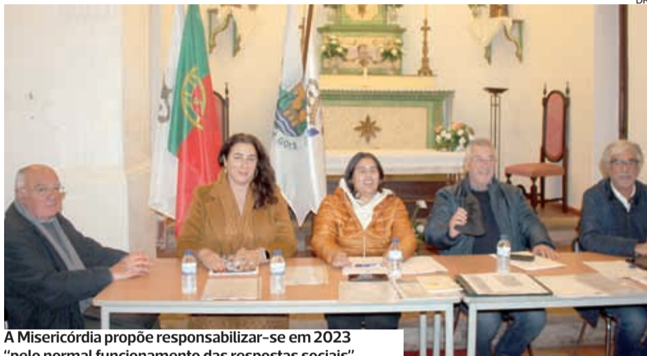
A Misericórdia propõe responsabilizar-se em 2023 “pelo normal funcionamento das respostas sociais”

●●● Atendendo a que cada vez se sentem “mais dificuldades”, o provedor da Santa Casa da Misericórdia de Góis alertou na última assembleia geral da instituição que essas situações “não deixam de ser agravadas também pelos escassos apoios financeiros, tanto do Governo, como das autarquias locais, que se verificaram anteriormente em forma de subsídios”.