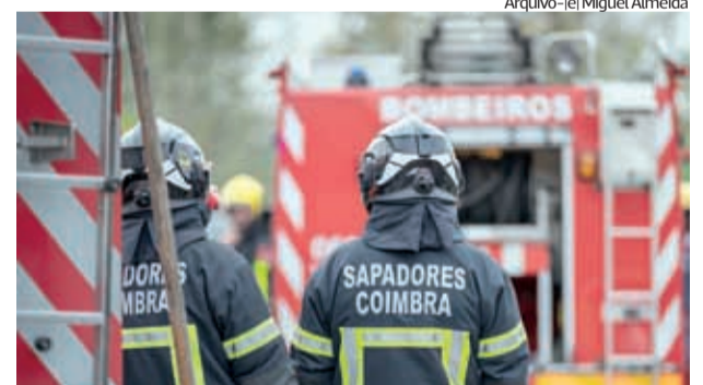
Arquivo - | Miguel Almeida

●●● Um homem de 82 anos sofreu ontem ferimentos considerados ligeiros, na sequência de despiste, seguido de colisão.