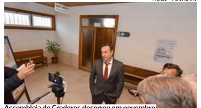
Assembleia de Credores decorreu em novembro

Estava prevista para ontem, mas afinal só hoje a Académica deve entregar, no Juízo de Comércio do Tribunal Judicial da Comarca de Coimbra, secção de Montemor-o-Velho, o Plano de Recuperação da Insolvência da Sociedade Desportiva Unipessoal por Quotas (SDUQ).