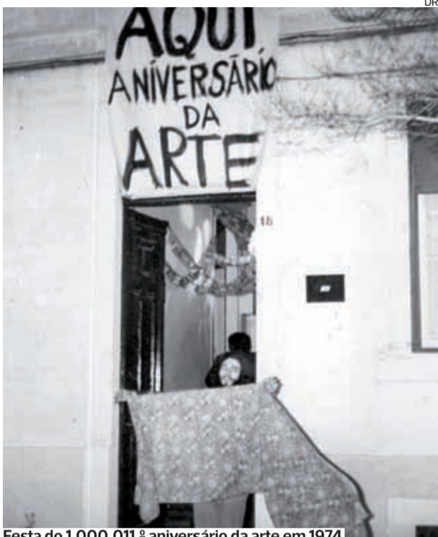
Festa do 1.000.011.º aniversário da arte em 1974

●●● A 17 de janeiro de 1974, Ernesto de Sousa organizou uma festa comemorativa do 1 000 011.º aniversário da arte em Portugal no Círculo de Artes Plásticas de Coimbra (CAPC). Passados 44 anos sobre esse evento, o CAPC promove um novo dia de festa com um vasto programa que começa com a republicação da carta-con-