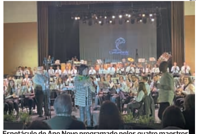
Espetáculo de Ano Novo programado pelos quatro maestros

●●● Cerca de 160 instrumentistas das quatro filarmónicas de Cantanhede – Phylarmonica Ançanense - Associação Musical; Associação Filarmónica Marialva de Cantanhede; Filarmónica de Covões e Associação Musical da Pocariça –, proporcionaram um concerto único no Multusos de Febres, perante cerca de 500 pessoas. Um espetáculo que podemos intitular “4 em Sinfonia”, com quatro bandas a interpretar um mesmo programa em plena harmonia e sintonia.