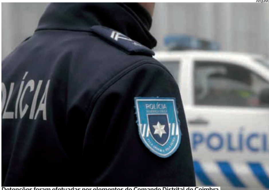
Detenções foram efetuadas por elementos do Comando Distrital de Coimbra

Detenções em Coimbra e Figueira da Foz, por furto, tráfico, condução sem habilitação e sob efeito do álcool