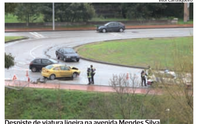
Despiste de viatura ligeira na avenida Mendes Silva

A operação redundou na apreensão de “525 quilos de carne e produtos cárneos e determinada a suspensão de atividade de três estabelecimentos de comércio de carne por preparação e venda de carnes e seus produtos com desrespeito das normas higiénicas e técnicas aplicáveis”, lê-se ainda no documento da ASAE. J.A.T.