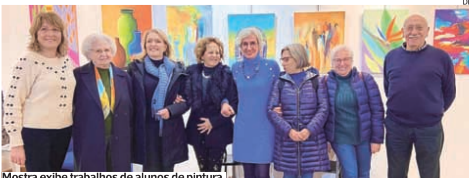
Mostra exhibe trabalhos de alunos de pintura

●●● “Perspetivas - 9.ª edição” é a primeira exposição de pintura deste ano da Magenta – Associação de Artistas pela Arte, patente na sua galeria. Esta mostra, que pode ser visitada até 2 de fevereiro, junta uma trintena de trabalhos realizados, em 2022, nas aulas de pintura da associação.