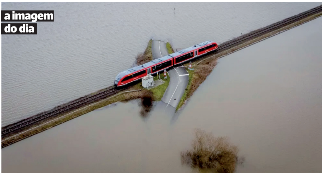
Um comboio regional passa por uma travessia ferroviária entre campos inundados em Nidderau-Eichen, perto de Frankfurt, Alemanha.