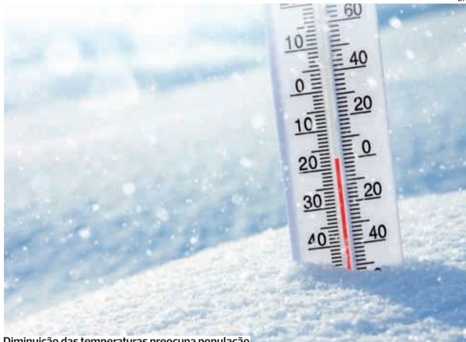
Diminuição das temperaturas preocupa população

●●● Perante a diminuição, observada e prevista, das temperaturas extremas (máxima e mínima), o Departamento de Saúde Pública da ARS Centro, através da coordenação regional do Plano de Saúde Sazonal Outono-Inverno 2022-2023/Estratégia Regional de Monitorização e Intervenção na Resposta Sazonal em Saúde, alertou a população para algumas medidas que devem ser tomadas, tendo em vista salvaguardar a saúde das mesmas.