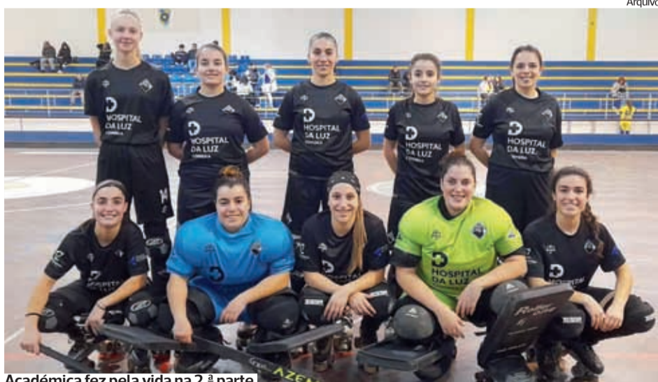
Académica fez pela vida na 2.ª parte

●●● A Académica garantiu um lugar no sorteio dos quartos de final da Taça Feminina, depois de vencer, em Odivelas, por 6-1.