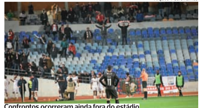
Confrontos ocorreram ainda fora do estádio

Elementos das duas claques trocaram “mimos” antes do início do Académica-U. Leiria desde domingo. Fonte da Polícia de Segurança Pública de Coimbra confirmou, ao DIÁRIO AS BEIRAS, que elementos destacados daquela força policial participaram a ocorrência.