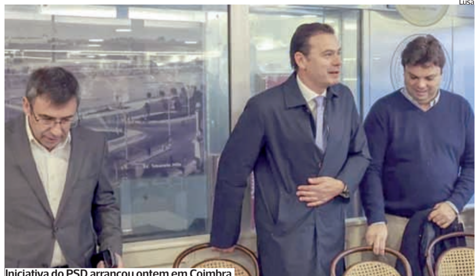
Iniciativa do PSD arrancou ontem em Coimbra