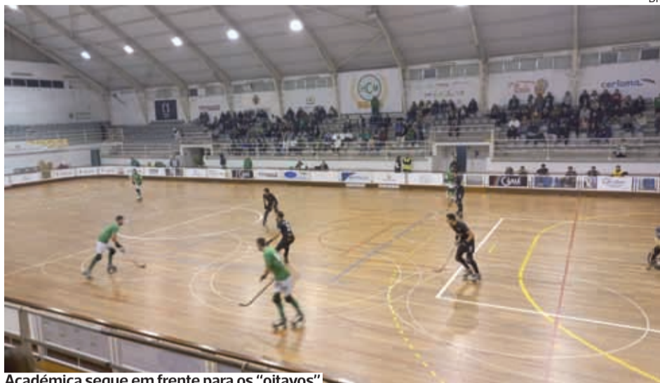
Académica segue em frente para os "oitavos"

●●● Foi um jogo digno de um dérbi, dentro e fora do campo. A Académica venceu em casa do HC Mealhada e seguiu em frente para os "oitavos" da Taça de Portugal.