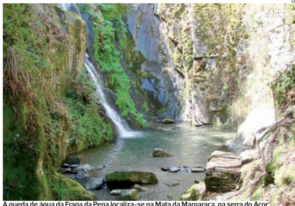
A queda de água da Fraga da Pena localiza-se na Mata da Margaraça, na serra do Açor

Segundo Luís Paulo Costa, o documento define um modelo de gestão e define as ações de promoção de educação ambiental, desen-